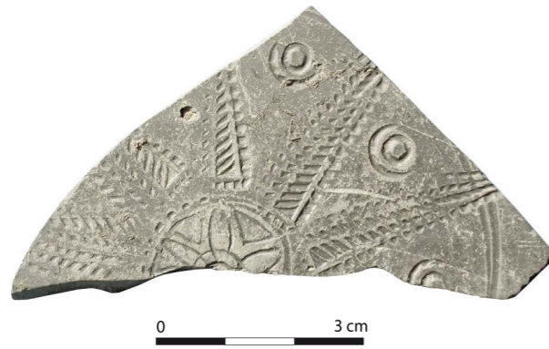
Fig. 1 - Fragment de DS.P. de Soissons "Place du Cloître".