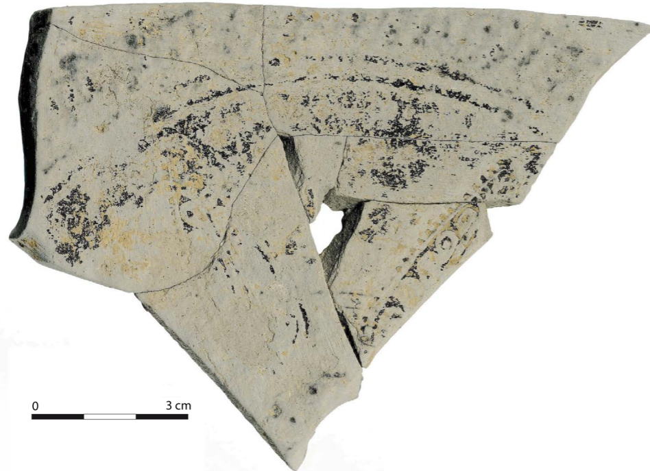
Fig. 2 - Fragment de dérivée sigillée paléochrétienne de Wailly-les-Arras.