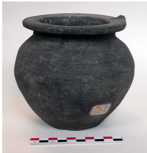
Fig. 115 - Oule des x e -xi e siècles découverte lors de la construction de l'Hôtel-de-Ville en 1893.

présence de sarcophages trapézoïdaux et le mobilier associé semblent attester un cimetière mérovingien. Le statut exact de cet habitat et son étendue sont très imparfaitement connus ; toutefois, il est hautement probable qu'il y ait continuité d'occupation entre l'Antiquité tardive et la première mention de la paroisse Saint-Martin au xii e siècle.