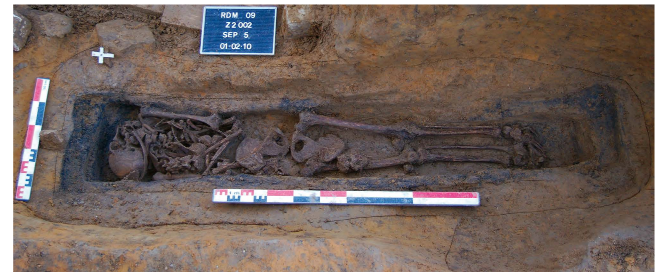
Fig. 114 – Quartier Saint-Crépin. Fouilles préventives du 3/5 rue de Madeleine. En haut : plan d'ensemble de la nécropole des ix e et x e siècles. 1 : sépulture d'homme ; 2 : sépulture de femme ; 3 : immature ; 4 : indéterminé. En bas : vue de détail d'une des sépultures montrant nettement une inhumation en cercueil monoxyle (dessin et cl. S. ZIEGLER - UACT).