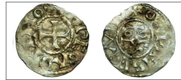
Fig. 118 - Monnaie avec légende « OTNNZE CASTERIO ».

La convergence de ces divers éléments permet d'assimiler le site à un véritable palais carolingien comportant camera (résidence), aula (salle d'apparat, siège administratif), capella (fonctions religieuses) et turris (élément défensif).