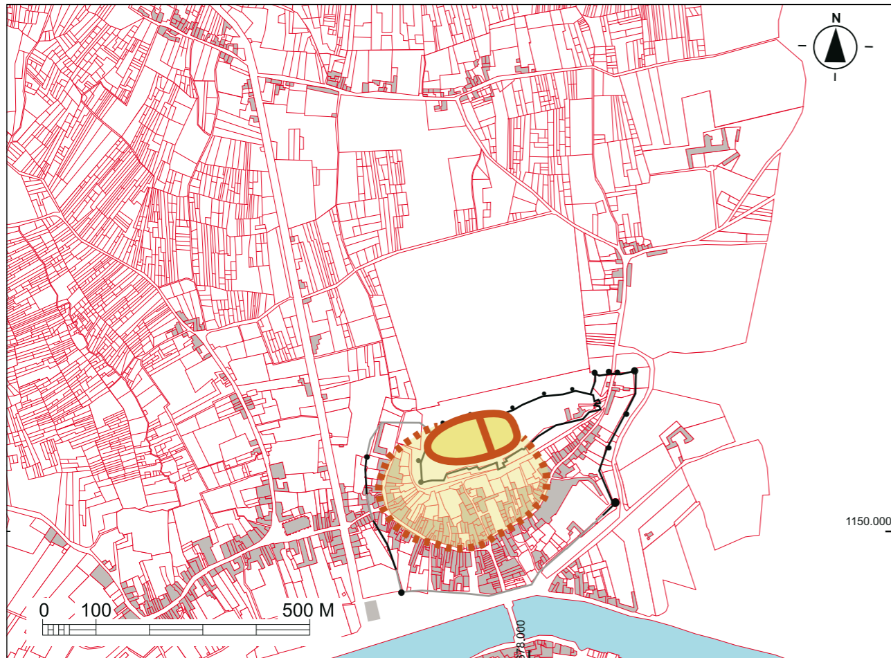
Fig. 117 - Essai de reconstitution du tracé du mur (figuré en pointillés) en relation avec le castrum , en tenant compte des formes du parcellaire du cadastre de 1820 et de l'observation du relief (dessin F. BLARY).

167 - Michel Bur souligne l'indépendance de l'Omois aux IX e et X e siècles, mentionnée en 871 dans une charte privée « Villa Novientum, sita in pago othmense, in vicaria otmense » (BUR, 1977, p. 97, n. 49).