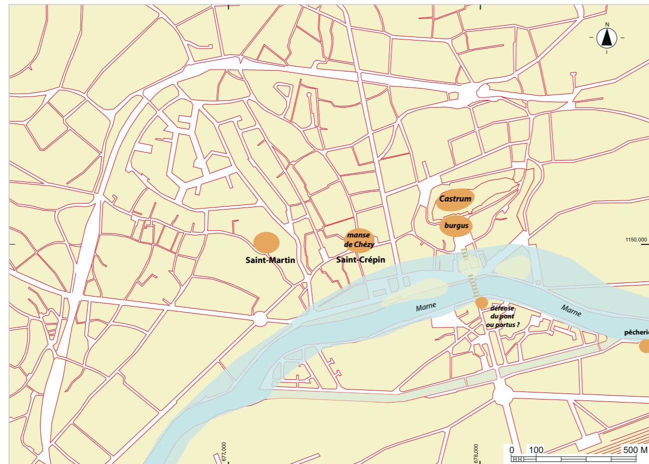
Fig. 113 – Situation des habitats des x e et xi e siècles reconnus sur le territoire de Château-Thierry (dessin F. BLARY).

suggère une partie économique hébergeant une population domestique relevant d'une mesnie et structurellement proche d'une « basse-cour ». Un habitat aristocratique s'est constitué à l'est de cette zone (fig. 113). Cette forme bipartite de l'habitat fortifié seigneurial se retrouve clairement dans les sites généralement intitulés « fortifications de terre » connus du x e au xiii e siècle. Un des types les plus fréquents de ces fortifications montre deux espaces clos, l'un de ces espaces est réservé exclusivement à la « vie noble », le second appelé basse cour est affecté à la vie économique et aux services. Cette hiérarchisation de l'espace peut s'appliquer au château de la première période des comtes de Vermandois commandant politiquement et militairement le pagus otmensis .