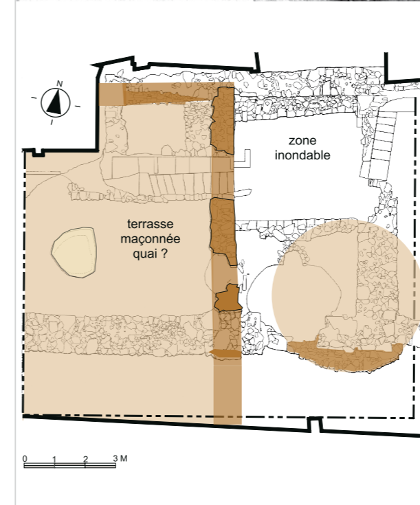
Fig. 116 - Fouilles de l'Hôtel des Trois Marchands, rive gauche de la Marne, intersection de la rue Carnot et du quai Galbraith : vue générale de la fouille et plan d'interprétation de la phase 1 datée de la deuxième moitié du xi e siècle (cl. et dessin F. BLARY).

1998). Ce gué antique se situait approximativement à hauteur de l'actuelle rue Pierre-et-Marie-Curie. En effet, le lit de la rivière était – à cet endroit – plus large et moins profond que de nos jours. Le cadastre napoléonien mentionne à proximité immédiate le micro-toponyme Le Moulin du Roi , le mot « roi » étant ici synonyme de « gué » (LACROIX, 2005).