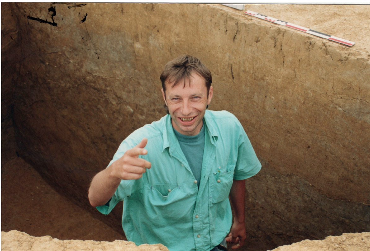
2003, Ploisy "le Bras de Fer", à l'assaut des plateaux.