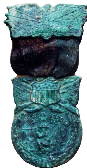
Fig. 1 - Médaille de garde-frontière de Francis Lupo retrouvée avec son corps.

terrassements préparatoires à cette opération de grande envergure que des ossements humains et des effets personnels ont été découverts en vrac dans le godet de la pelle hydraulique. Il n'a pas fallu longtemps, en examinant les boutons d'uniforme, pour réaliser qu'il s'agissait de restes américains de la Première Guerre mondiale et pis encore, d'au moins deux individus aux ossements mélangés. Si à l'époque, les services officiels pour la relève des corps de combattants, qu'ils soient Français ou Allemands, se montraient peu regardant sur l'état de la sépulture et les circonstances de la découverte, il n'en était pas de même pour les Américains, très susceptibles sur ces questions. Circonstance aggravante, les États-Unis connaissaient alors une crise diplomatique avec la France en raison du refus de cette dernière de participer à la deuxième guerre d'Irak. Et voilà Fred avec sur les bras un sac d'os de soldats américains, découverts dans des circonstances bien peu respectueuses. Difficile de remettre les corps aux autorités dans cet état. Les ossements ont donc été lavés, conditionnés proprement dans des sacs en papier kraft. Les éléments d'uniformes et les effets personnels ont été soigneusement placés dans des boîtes en plastique. La récupération des dépouilles des deux